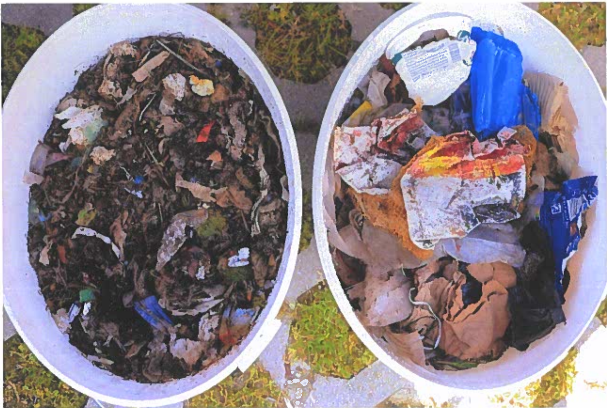
Výsledný produkt triedenia na nadsitnú a podsitnú frakciu

Ďalším významným faktorom, ktorý môže vplývať na cenu, sú podľa zväzu regionálne rozdiely. Napríklad ceny za skládkovanie môžu byť vyššie v oblastiach s nižším počtom skládok, alebo tam, kde je prístup k iným spôsobom nakladania s odpadom obmedzený.